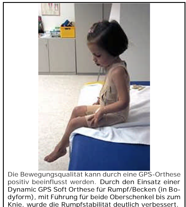
Die Bewegungsqualität kann durch eine GPS-Orthese positiv beeinflusst werden. Durch den Einsatz einer Dynamic GPS Soft Orthese für Rumpf/Becken (in Bodyform), mit Führung für beide Oberschenkel bis zum Knie, wurde die Rumpfstabilität deutlich verbessert.

ritäten zu formulieren. Da die orthopädischen Probleme wesentlich die Beeinträchtigungen im Erwachsenenalter bestimmen, ist es extrem wichtig, diese frühzeitig therapeutisch zu adressieren.