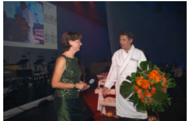
Der Star der letzten Gala: Udo Jürgens. Auch in diesem Jahr ist wieder ein spektakuläres Programm für die Goodyear Dunlop Handelssysteme geplant. In unserer nächsten Ausgabe werden wir ausführlich darüber berichten.

den über 1.000 Gästen ein möglichst hohes Spendenvolumen zu generieren.