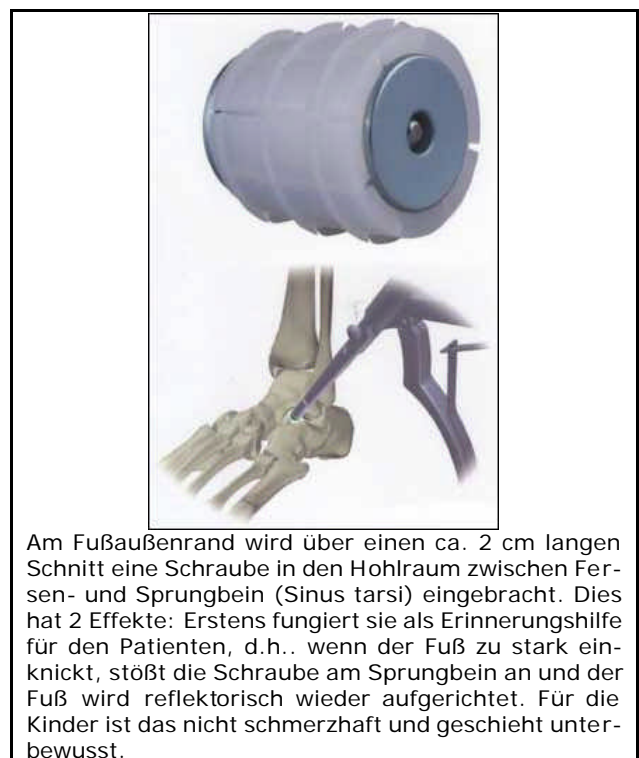
Am Fußaußenrand wird über einen ca. 2 cm langen Schnitt eine Schraube in den Hohlraum zwischen Fersen- und Sprungbein (Sinus tarsi) eingebracht. Dies hat 2 Effekte: Erstens fungiert sie als Erinnerungshilfe für den Patienten, d.h. wenn der Fuß zu stark einknickt, stößt die Schraube am Sprungbein an und der Fuß wird reflektorisch wieder aufgerichtet. Für die Kinder ist das nicht schmerzhaft und geschieht unterbewusst.