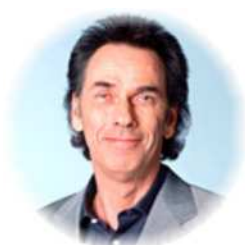
Hugo Egon Balder