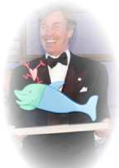
Seine königliche Hoheit Prinz Leopold von Bayern